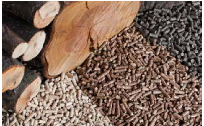
Processus de production Produktsverfahren von