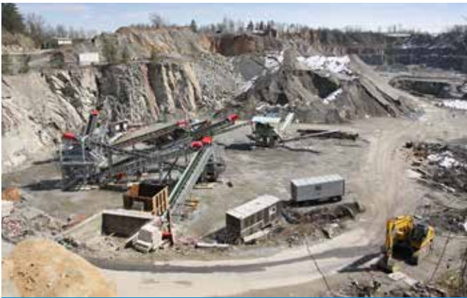
Production d'énergie et exploitation minières Energieerzeugung und Bergbau