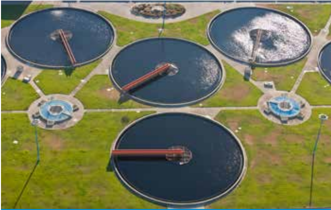
Municipal Anwendung in Stadtwerken