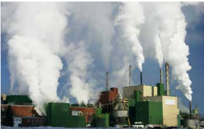
L'industrie papetière Zellstoff- und Papierindustrie