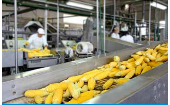
Nourriture et boisson Nahrungsmittel und Getraenke